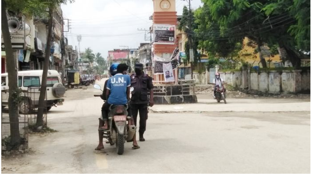
निषेधाज्ञा जाँचि गरिपछि सडकमा मोटरसाइकल गुडाउनेलाई प्रहरीले सोधपुछ गर्दै